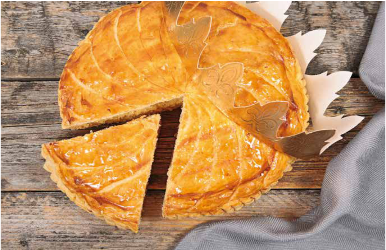
Galette des Rois, der traditionelle Dreikönigs-Blätterteig-Kuchen in Frankreich.

Überlieferung die Asche das Haus im nächsten Jahr vor Blitzeinschlag schützt.