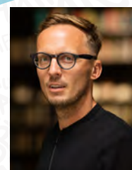
Michal Hvorecký